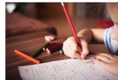
Učenici s posebnim potrebama