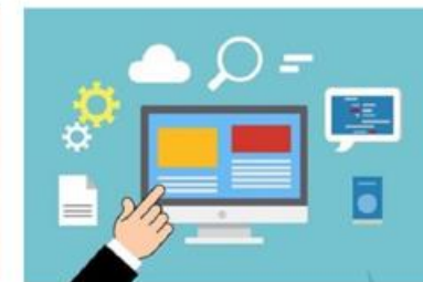
Tehnička potpora „i-nastavi“